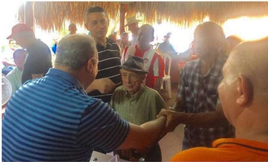
Reunión con amigos y líderes de Juan de Acosta.