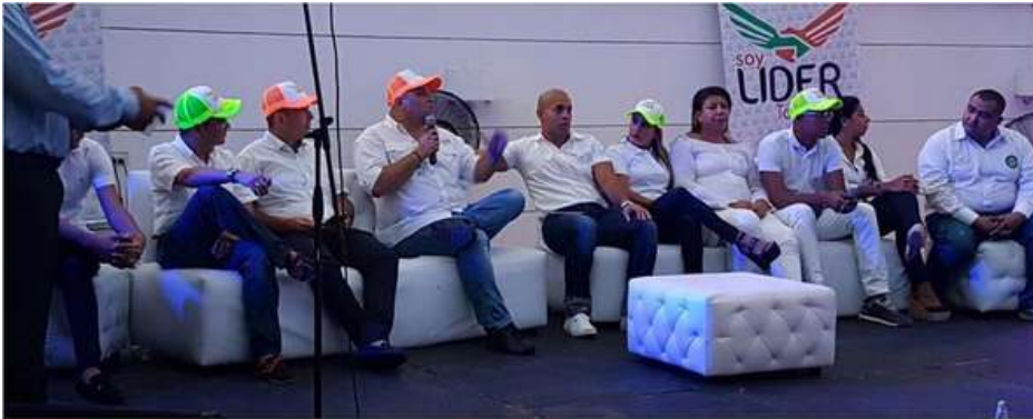
Conversatorio "Soy líder Tomásino", en Santo Tomás.